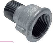
Typ 246/M4 red